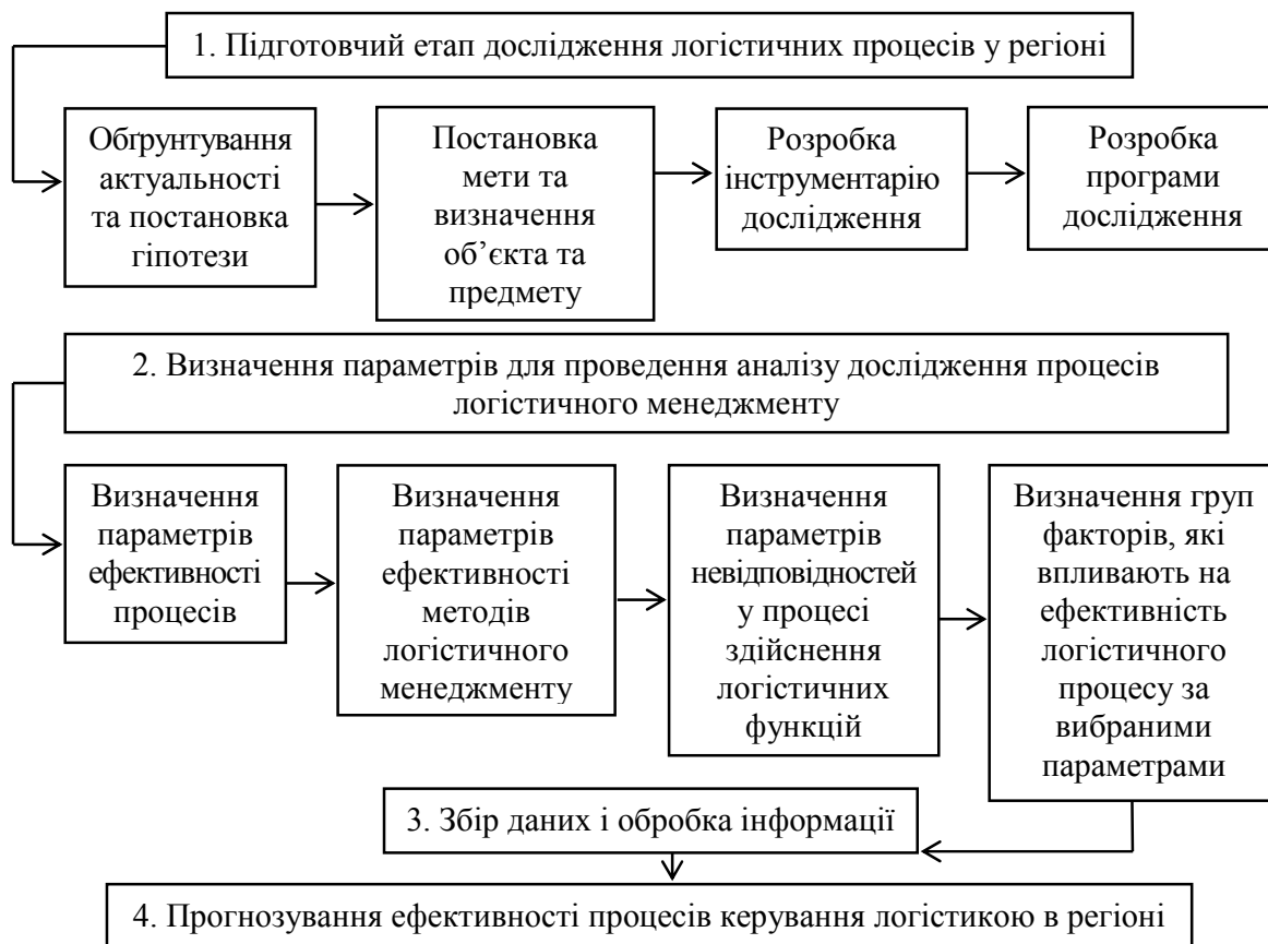
Рисунок 3 – Алгоритм проведення досліджень логістичних процесів у регіоні

Застосовуючи процесний підхід до дослідження процедур керування матеріальними, фінансовими, інформаційними потоками, необхідно визначити потреби на вході логістичного процесу керування потоком і відповідність їх реалізованому кінцевому продукту керування.