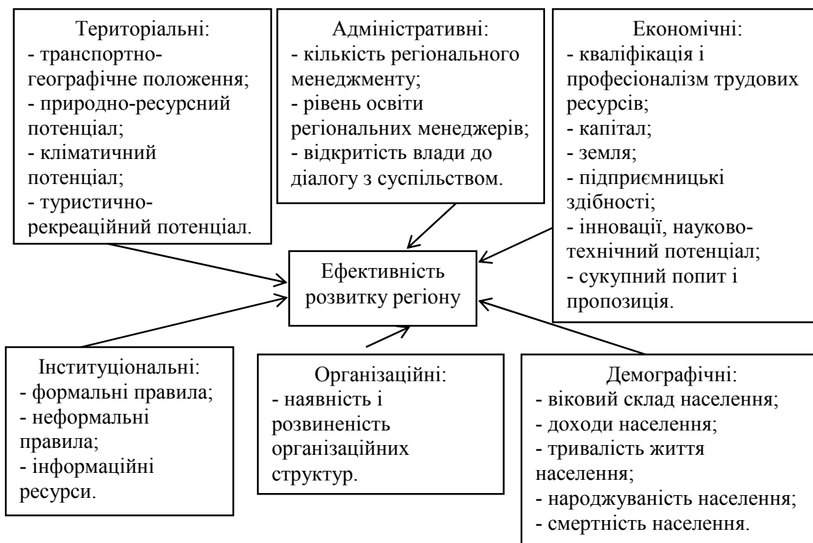
Рисунок 1 – Групи факторів, які впливають на ефективність розвитку регіону

Дослідження поля логістичного менеджменту являє собою послідовний організований процес сегментування логістичних потоків за пріоритетними ознаками вивчення факторів, які впливають на ефективність логістики регіону.