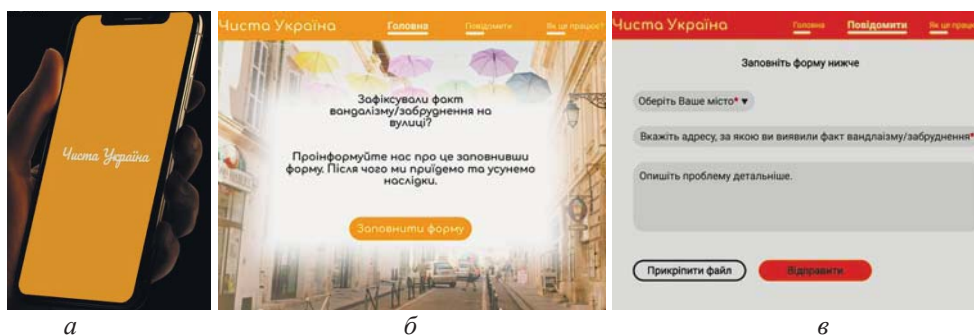
а – назва інтерактивного макету; б – головна сторінка; в – сторінка повідомлення